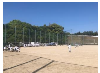
生徒のみなさん、お疲れ様でした！